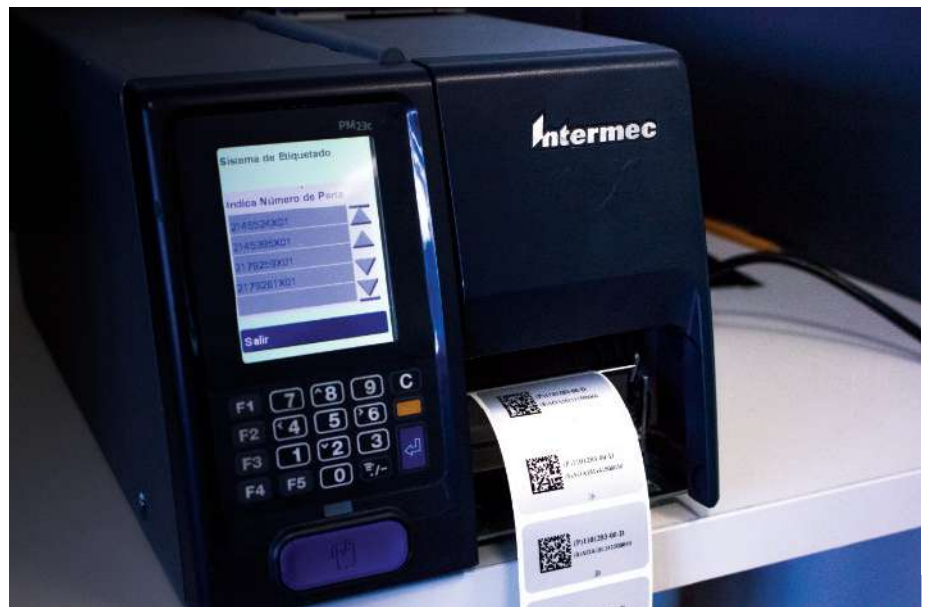
Sistema instalado en Impresora Honeywell PM23 y PM43

Para este sistema la impresora trabaja de forma autónoma por lo que no se necesita tener una computadora intermedia lo cual automatiza más el proceso aparte de ahorrar espacio y quitar un elemento que requiere mantenimiento.