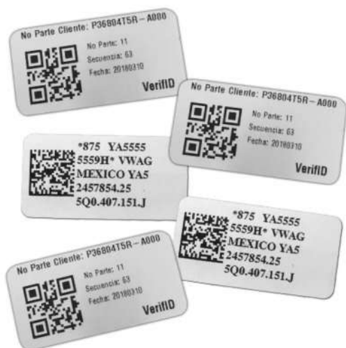
Etiqueta especializada para autopartes y manufactura